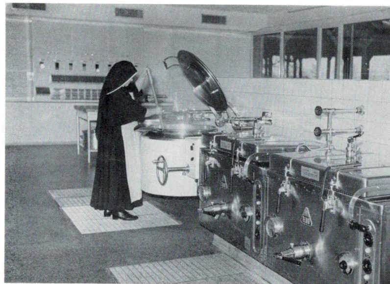
Auch die Studenten leben nicht von der Luft